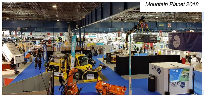
Mountain Planet 2018